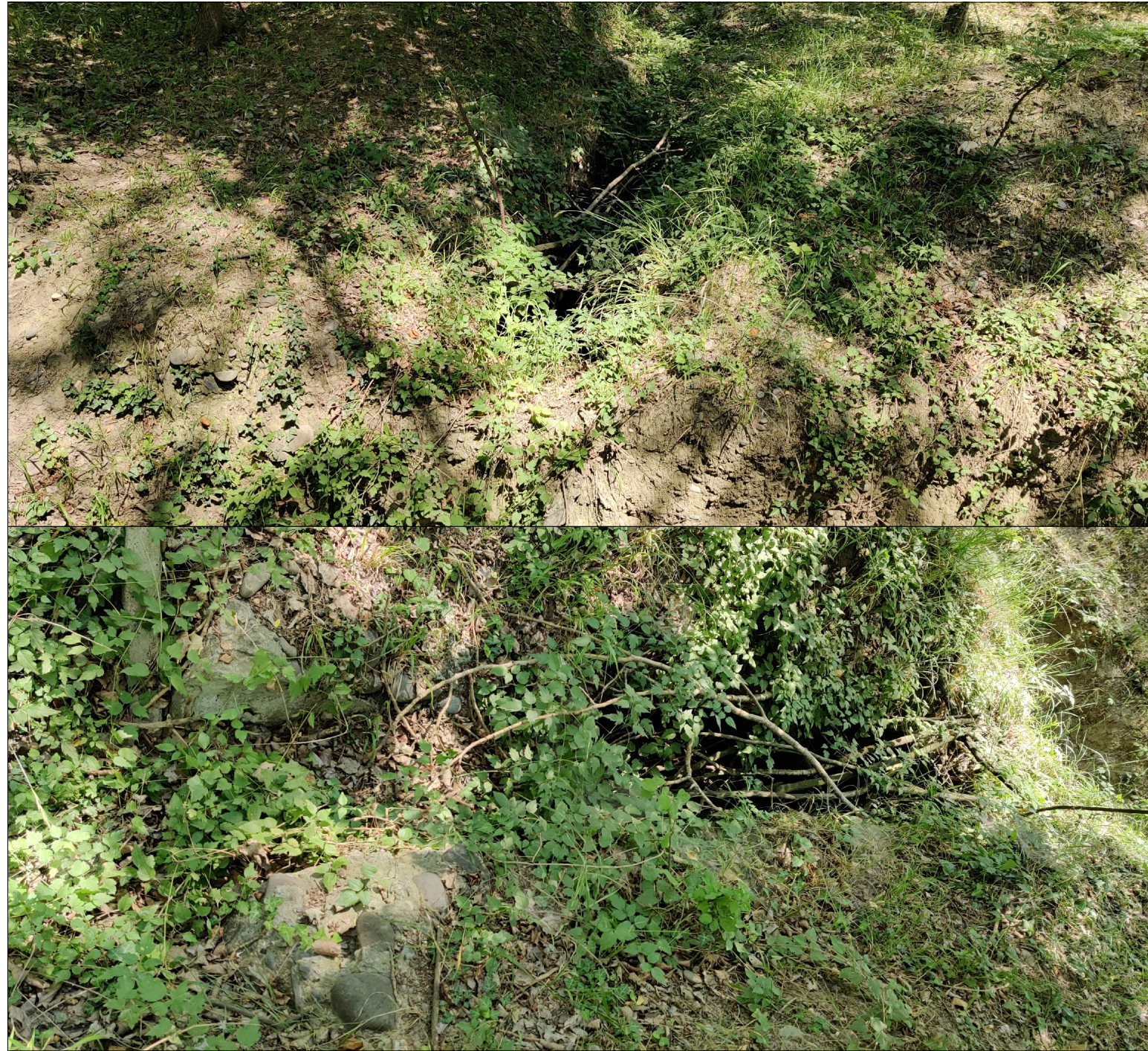
ბაღერის კპ 169+95 ბაღასუბრის ფილების სპეციფიკაცია